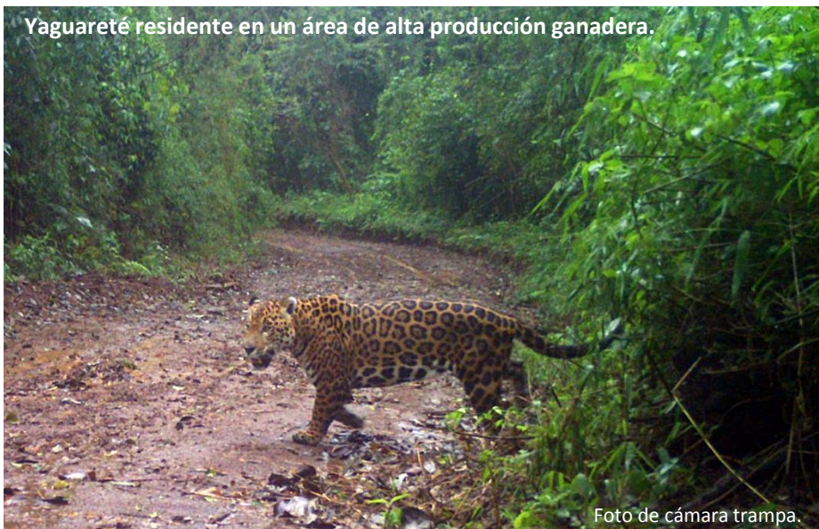
Yaguareté residente en un área de alta producción ganadera.

En el paraje Tamanduá, provincia de Misiones, Argentina, la selva ha ido siendo reemplazada por campos para producción ganadera. La gran cantidad de terneros representó una oferta de presas fáciles a los yaguaretés que desde siempre habitaron allí. Naturalmente, el predador tope de América comenzó a alimentarse de ellos y los ganaderos, como represalia -y ante la ausencia de otras alternativas-, históricamente los mataron. Esto llevó -junto a otros factores- a que la población de este felino se encuentre actualmente en Peligro Crítico de Extinción.