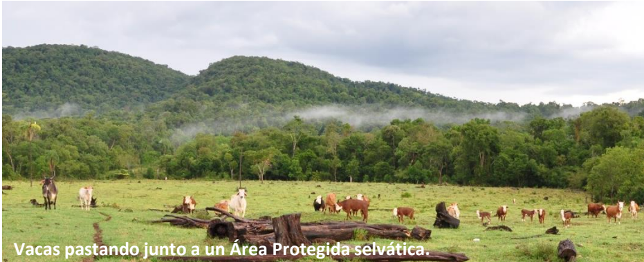
Vacas pastando junto a un Área Protegida selvática.