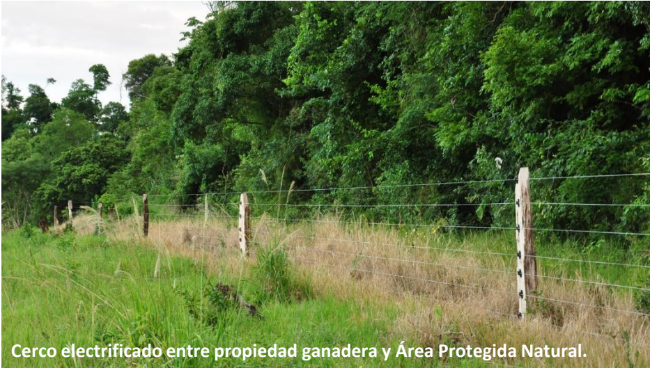
Cerco electrificado entre propiedad ganadera y Área Protegida Natural.