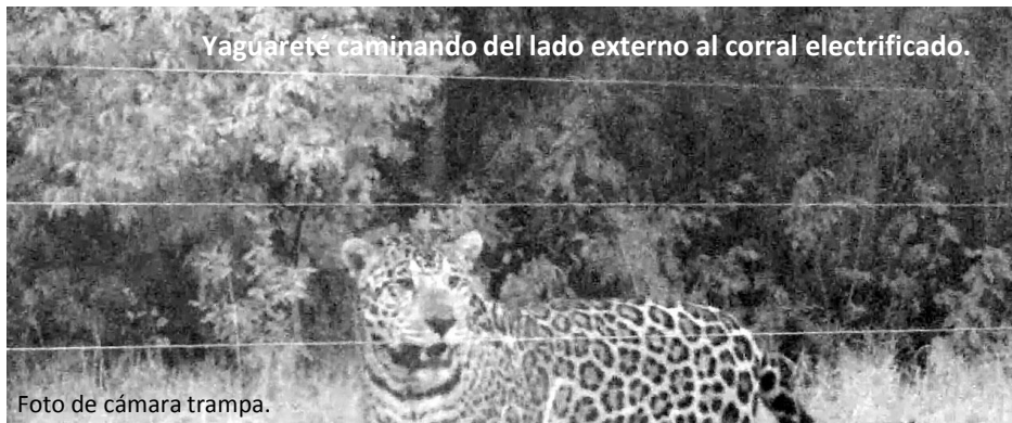
Yaguareté caminando del lado externo al corral electrificado.

Se buscó dificultar seriamente los ataques de yaguareté a terneros mediante la implementación de corrales electrificados, para de este modo aliviar la habitual respuesta de los ganaderos afectados de eliminar al gran felino.